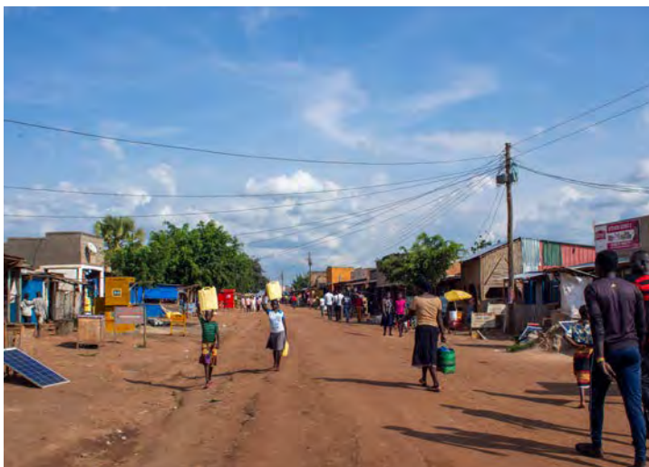
Straßenszene in Bweyale (Uganda): Frauen transportieren Wasser in Wasserkanistern.

Normalerweise ist beim Eintreffen der Wasserfilter im Zielgebiet der Einsatzort klar, alle Beteiligten wissen Bescheid und entsprechende Genehmigungen liegen vor. Eigentlich. Doch bisher fanden unsere Einsätze auch nicht während einer weltweiten Pandemie statt. Die Folgen der Corona-Pandemie führten dazu, dass der ursprünglich vorgesehene Standort vor einem Ladengeschäft nicht mehr zur Verfügung stand, da es aufgrund eines Lockdowns geschlossen wurde. Doch unsere Freunde vom Kinderdorf in Bweyale engagierten sich und fanden den idealen Standort Stadtbezirk Nyamusasa.